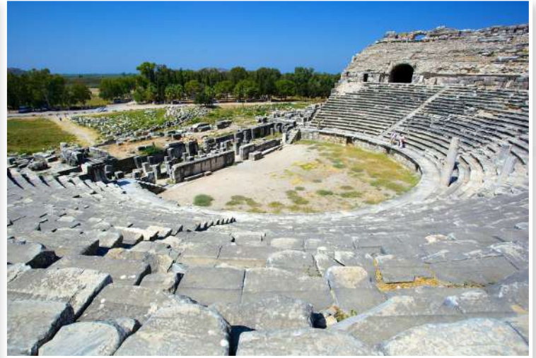
Μίλητος - Αρχαίο Θέατρο